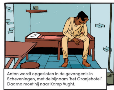
Ontwikkeling illustratie van De Kom in Oranje-hotel. Bron: Karida van Bochove