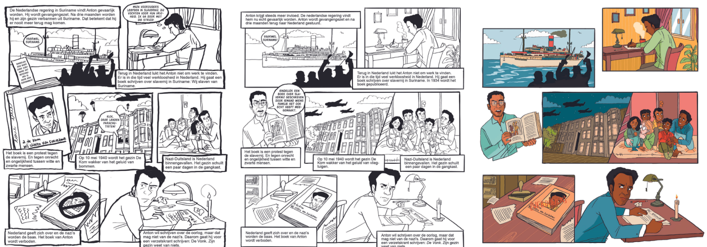
Ontwikkeling van 4 en 5 mei Denkboek pagina 3.

In het geval van de strip over Anton de Kom was er bijvoorbeeld geen foto van Anton op jongere leeftijd. Ik heb me voor een illustratie van een jonge Anton gebaseerd op foto's van hem op latere leeftijd, en daar zo veel mogelijk kenmerken van gebruikt. We hebben de tekeningen ook voorgelegd aan familie van De Kom. We vonden het belangrijk dat zij zich erin konden vinden. Voor de meeste plekken die voorkomen in de strip was gelukkig wel veel visueel materiaal beschikbaar. Zo is de illustratie van De Koms cel in het Oranjehotel gebaseerd op historische foto's. Ook het schip waarmee hij naar Nederland reist en de erker van het huis waar hij in Nederland woonde, zijn zo waarheidsgetrouw mogelijk weergegeven. Van zijn ouderlijk huis in Paramaribo is zelfs een maquette beschikbaar die is gemaakt als