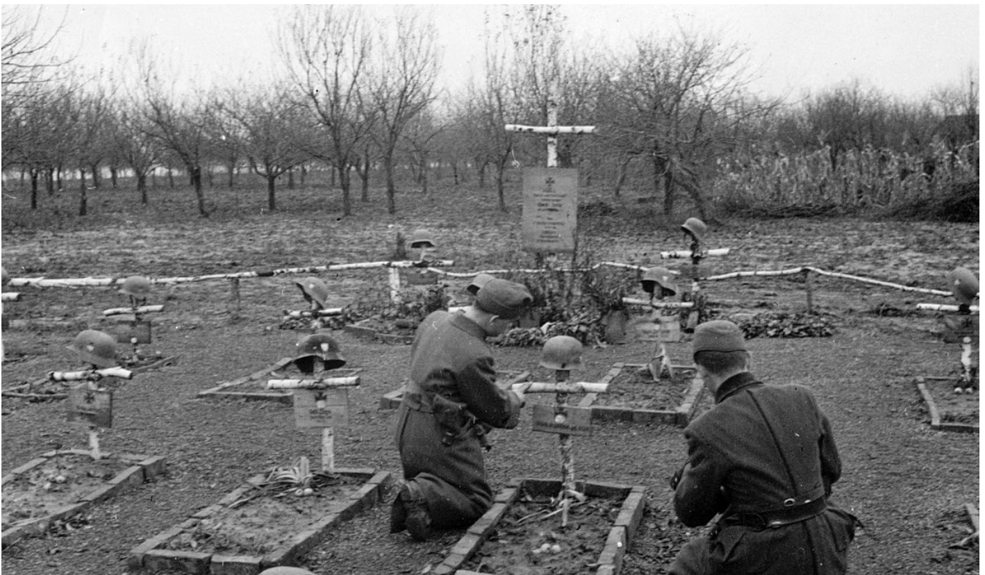
Hongaarse begraafplaats in Oekraïne, Vinnytsja, 1942.