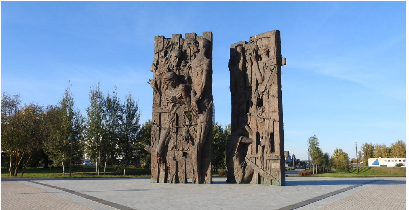
Monument voor Maly Trostenets in Minsk, 2018.

de Holocaust. Deze verhalen zijn cruciaal gebleken voor het schrijven van grote delen van de geschiedenis van de Holocaust. Zonder ooggetuigen zouden kampen als Sobibor, Maly Trostenets of Chelmno nooit tot in bepaalde details beschreven zijn, en zonder ooggetuigen zouden we niets weten van specifieke aspecten van de onderduik, dwangarbeid of deportaties.