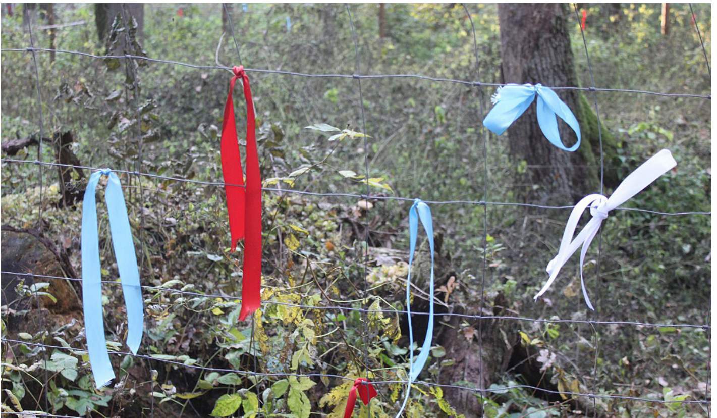
Begraafplaats A in het bos naast het voormalige vernietigingskamp Sobibor, 2018.

Een laatste ongemakkelijkheid van herdenken is de ongemakkelijkheid van het niet-weten en het vergeten. Misschien is het deze vorm van ongemak wel die we het meest moeten omarmen. Dit is waar de herinneringscultuur