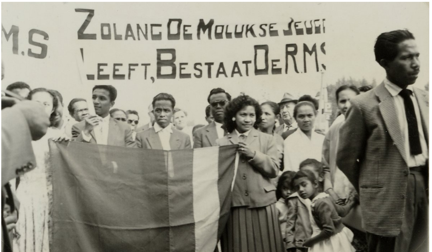
Demonstratie met Molukse vlag en spandoek, ca 1955.

vormen vervolgens het leger van de RMS. Voor de bijna 5000 anderen die buiten de Molukken in kazernes zitten, is het niet mogelijk om zich bij dit leger aan te sluiten, alhoewel een meerderheid zich solidair verklaart met de RMS en op basis van de bestaande KNIL-regelingen om demobilisatie en transport naar Ambon vraagt. De Indonesische regering vindt dat echter niet acceptabel, omdat Ambon als opstandig gebied wordt gezien. Nederland wil de verhoudingen met Indonesië niet nog meer verslechteren en besluit, nadat een gerechtelijke uitspraak demobilisatie op Indonesisch grondgebied verbiedt, de militairen en hun gezinnen tijdelijk naar Nederland over te brengen. Dit in de hoop en verwachting dat ze na een kort verblijf zullen realiseren dat een onafhankelijke Molukse republiek geen haalbare kaart is en dat terugkeer naar Indonesië onvermijdelijk is.