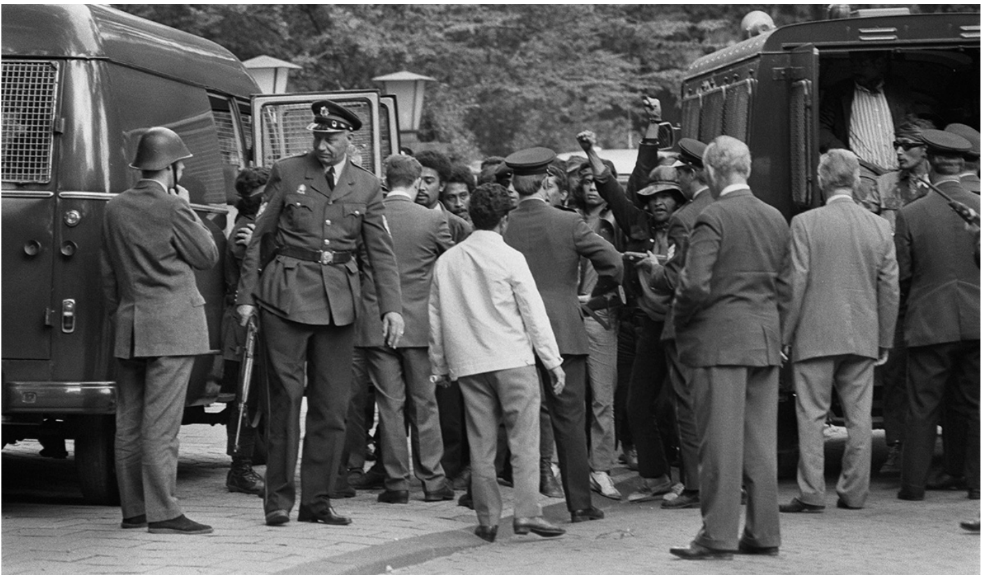
De bezetters van de residentie van de Indonesische ambassadeur worden opgepakt.