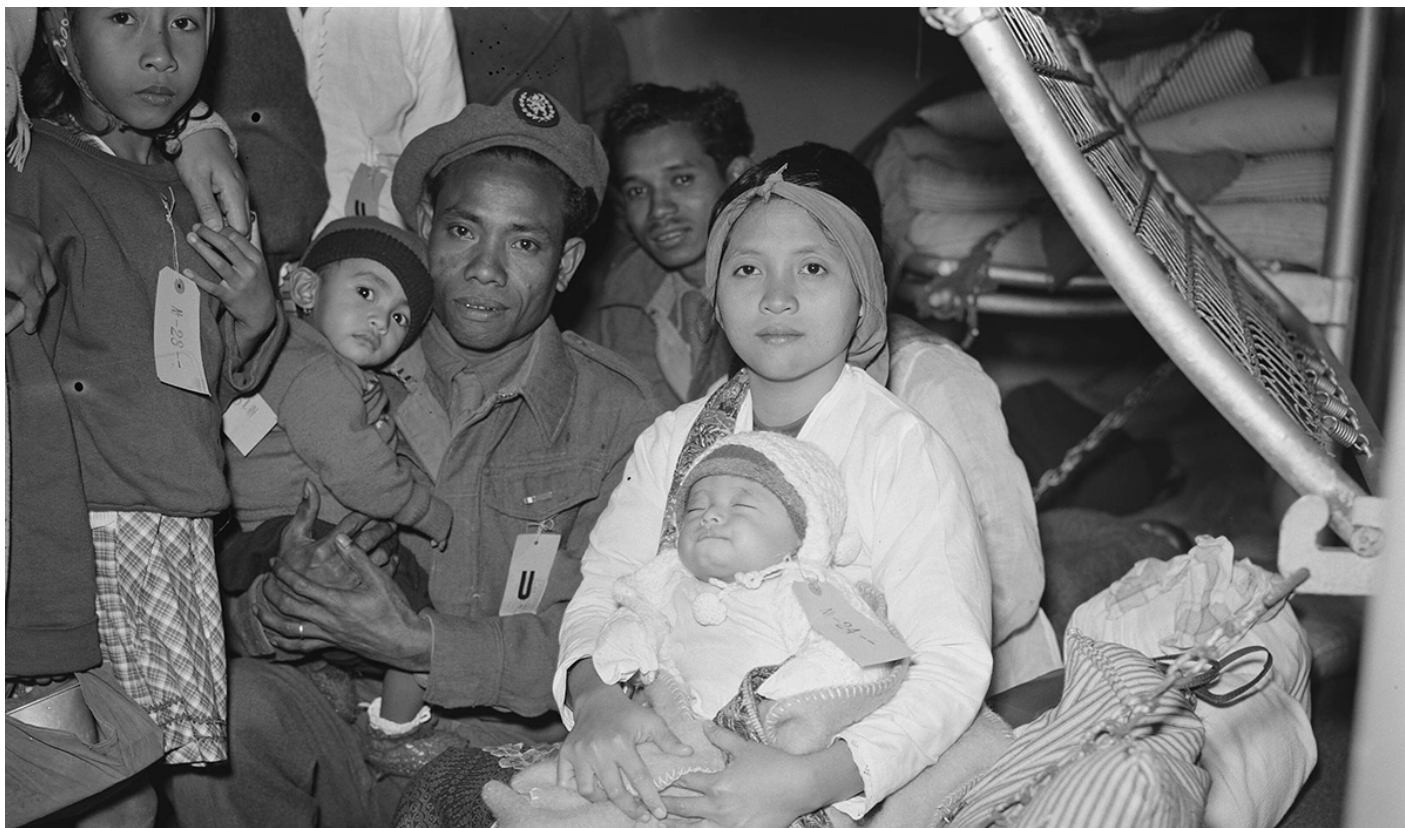
De eerste Molukkers komen met het schip Kota Intern aan in Nederland.

bij mondiale maatschappelijke veranderingen. Molukse jongeren nemen deel aan de opkomende jeugdcultuur in Nederland, waarbij traditionele verhoudingen en traditioneel gezag worden uitgedaagd. Er komen meer confrontaties. Zo is de komst van de weduwe van de tweede president van de RMS, mr. dr. Chris Soumokil, in 1966 aanleiding tot brandstichting bij de Indonesische ambassade. Op 31 augustus 1970 is het aanstaande bezoek van de Indonesische president Soeharto aanleiding voor de bezetting van de residentie van de Indonesische ambassadeur in Wassenaar. Daarbij komt een politieagent om het leven, maar de 33 bezetters worden in Molukse kring gezien als vrijheidsstrijders die erin zijn geslaagd de wereldpers attent te maken op de zaak van de RMS. Als daaropvolgende gesprekken tussen de Nederlandse regering en Molukse voorlieden over Molukse wensen voor steun en erkenning van de RMS op niets uitlopen, is dat de opmaat tot de kapingen en gijzelingen van 1975, 1977 en 1978. 10