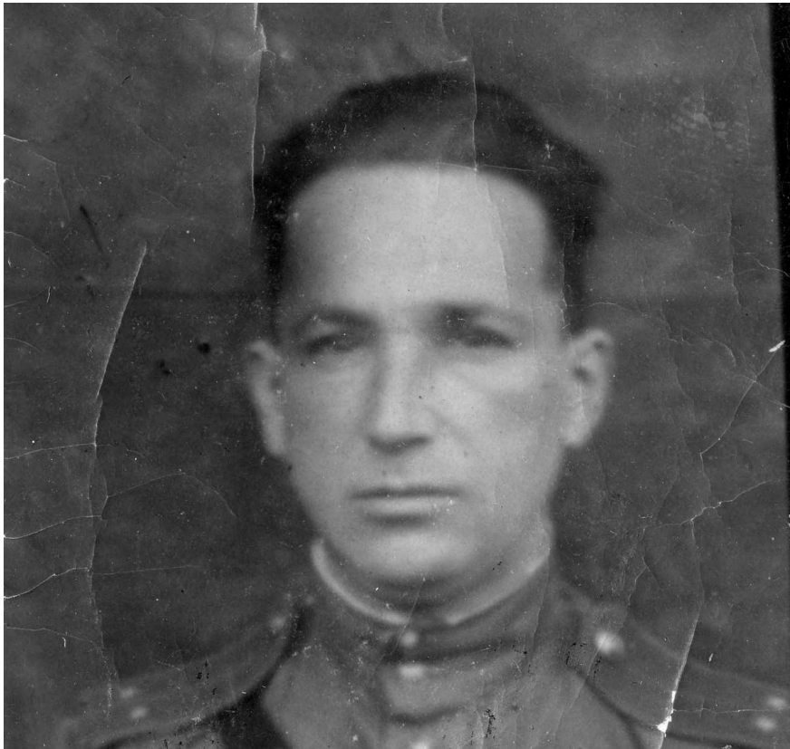
Alexander Pechersky in 1944/45.