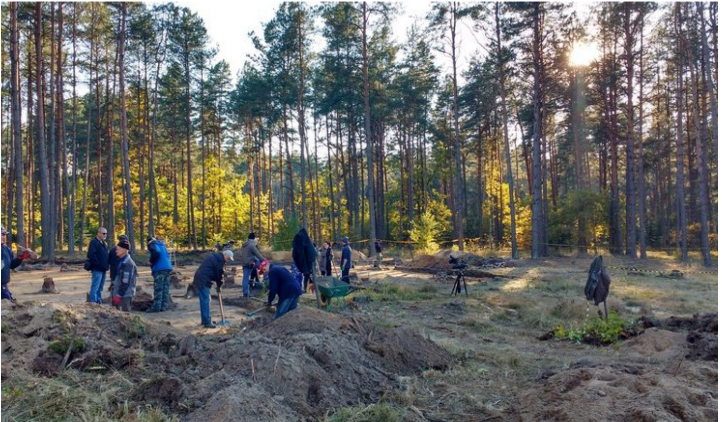
Archeologische opgravingen in Sobibor.

Reinhardt tezamen. Bovendien was Auschwitz ook een plek van Pools martelaarschap, dat zo op één lijn kon worden gesteld met het Joodse leed.” 3