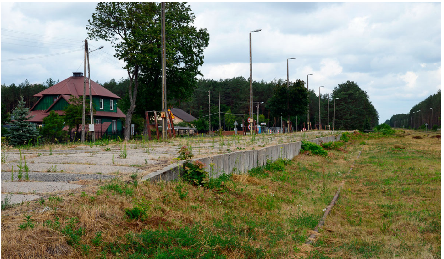
De commandantwoning (groene woning links) in Sobibor.

De vier hier besproken boeken geven samen een overtuigend antwoord op de vraag waarom de Operatie Reinhard-kampen zo lang in de vergetelheid zijn geraakt. Mooi is dat, zoals Schumacher laat zien, het beeld inmiddels wel meer gelaagd is. “Meer Polen zien Auschwitz tegenwoordig in de eerste plaats als plek van de Holocaust, terwijl er ook een groep is gegroeid die Auschwitz primair als plek van niet-Joods Pools leed beschouwt.” 12 Sobibor en het met zo veel moeilijkheden en onenigheid geopende nieuwe museum zetten ons er in elk geval toe aan te beseffen waartoe mensen in staat zijn: moord op industriële schaal. Kropman: