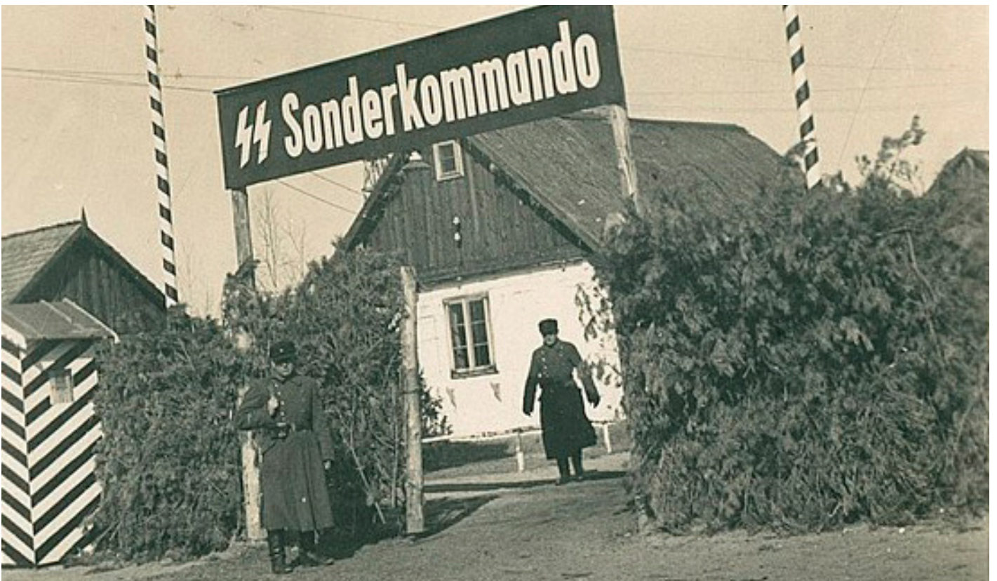
De poort van vernietigingskamp Sobibor, 1942/43.

Veel indruk maken ook de duizenden persoonlijke bezittingen die op het terrein bij de opgravingen zijn en worden aangetroffen. Die bezittingen staan samen met begeleidende, ontroerende verhalen centraal in Erik Schumachers Sporen van Sobibor . Dit boek grijpt je als lezer geregeld bij de keel. Bij Schumachers beschrijving van de vondst van een pop hou je het niet droog. Speelgoed wordt bij de opgravingen zelden gevonden, al werden er in de Holocaust naar schatting anderhalf miljoen kinderen vermoord. “Het zal kort na