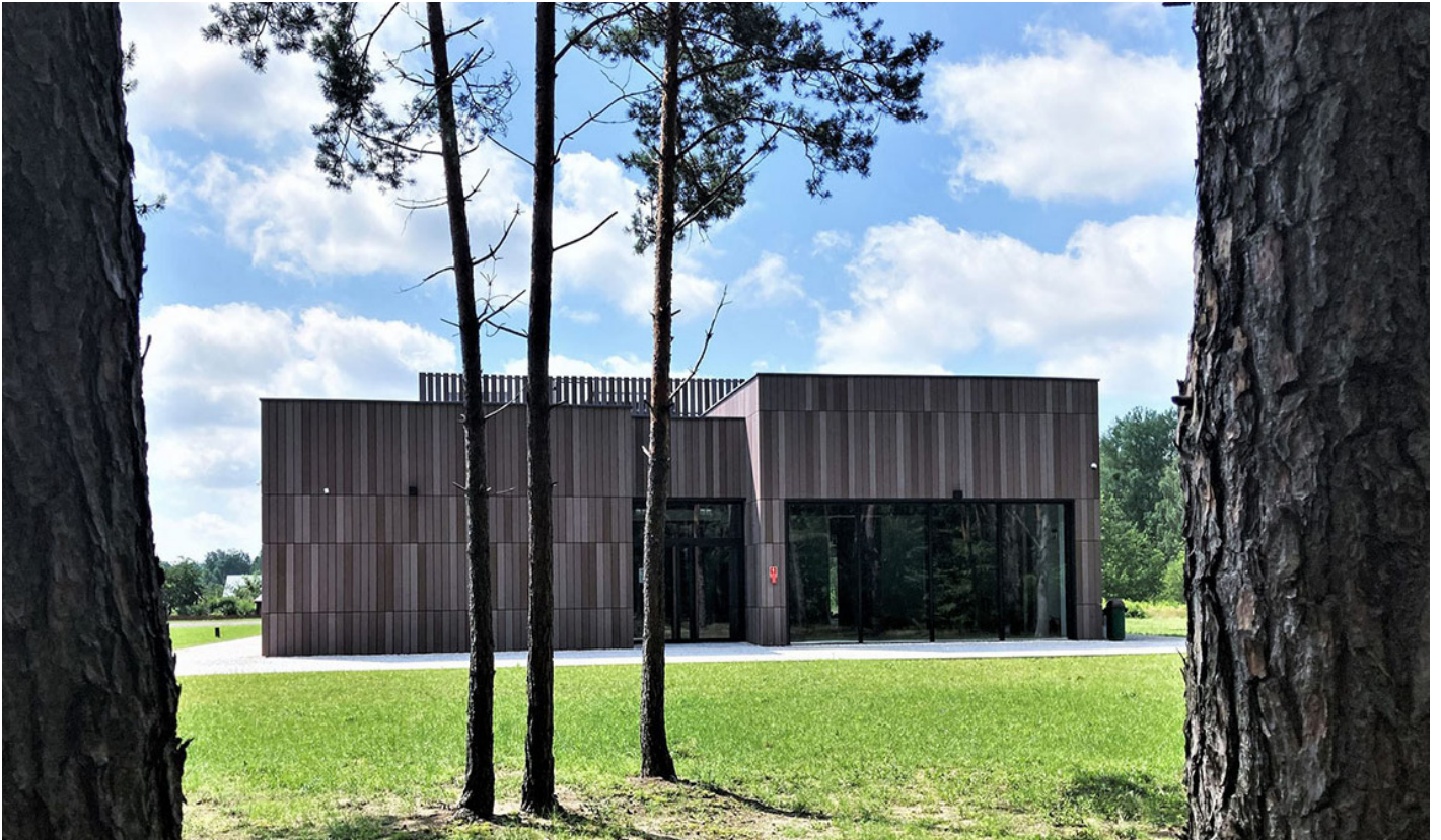
Het herinneringscentrum in Sobibor.

“Daarom moeten wij ons juist Sobibor expliciet blijven herinneren, hoe moeilijk ook, omdat het de waarschuwing is voor het donkerste donker in onszelf. Voor nu, over honderd jaar, over vijfhonderd jaar.” 13